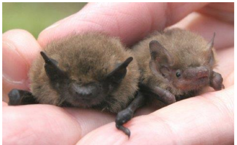
Winzlinge mit Echoortung: Zwergfledermaus (links) und Mückenfledermaus (rechts) in einer Hand.

19 Fledermausarten gibt es in Hessen, 18 davon kommen im Rhein-Main-Gebiet vor. Nur die Kleine Hufeisennase ist hier nicht heimisch. Deutschlandweit sind 25 verschiedene Arten nachgewiesen.