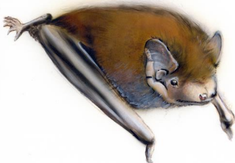
Kleiner Abendsegler Myotis leisleri