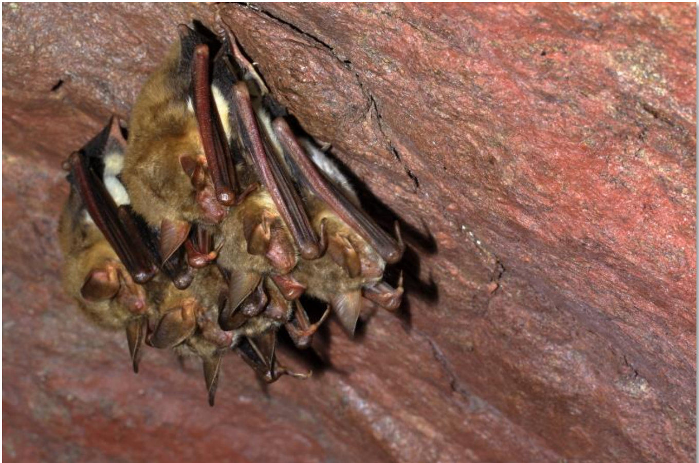
Winterschlaf – Cluster Große Mausohren