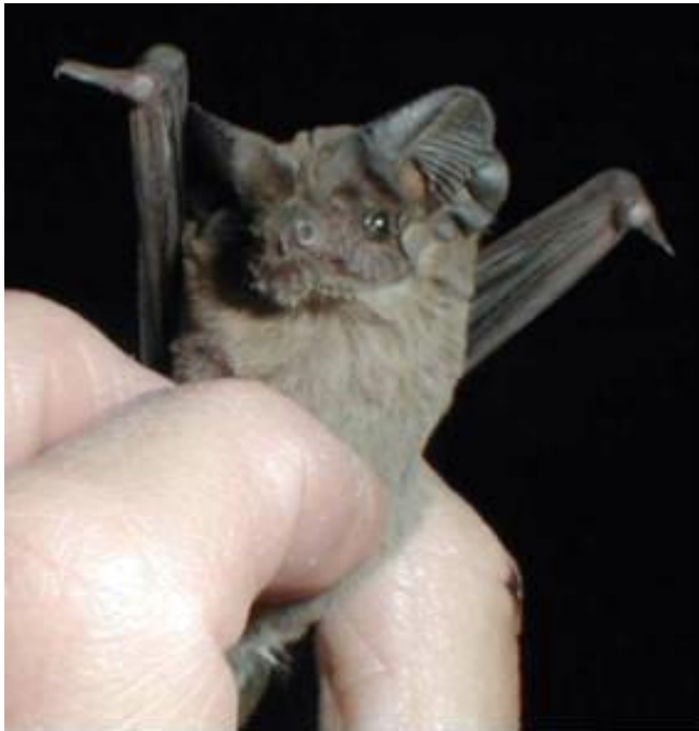
Mexikanische Bulldoggfledermaus ( Tadarida brasiliensis )

Honolulu (USA) - Eine neu entdeckte Muskelgruppe könnte klären, wie Fledermäuse die räumliche Ausbreitung ihrer Schreie kontrollieren können: Mit Hilfe spezieller Gesichtsmuskeln beeinflussen manche Fledermäuse, ob sie einen schmalen oder einen breiten Schallkegel produzieren und optimieren so ihre Orientierung per Echolot. Die wendigen Flugsäugetiere formen ihr Maul dabei mitunter ähnlich, wie sich der menschliche Mund beim Aussprechen des Lautes „O“ formt. Das haben zwei amerikanische Neurowissenschaftler bei einer amerikanischen Fledermausart beobachtet. Die Tiere heben dazu vor jedem Ultraschallimpuls, den sie zur