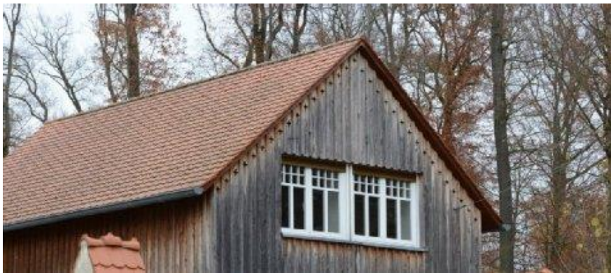
Hinter den kreuzförmigen Lüftungsschlitzen des Forsthausnebengebäudes hat sich die Mückenfledermaus eingemischt.

Familie Stroh beherbergt eine große Kolonie der seltenen Mückenfledermaus.